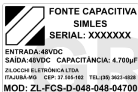
VISÃO DA ETIQUETA LATERAL